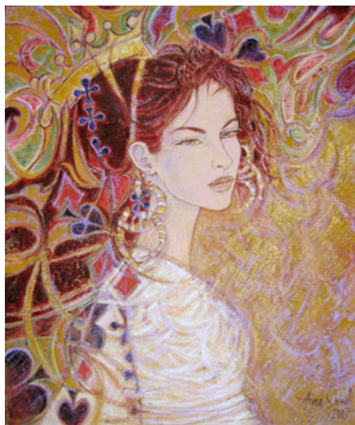
Reine des dames Huile sur toile – 46 x 55 cm